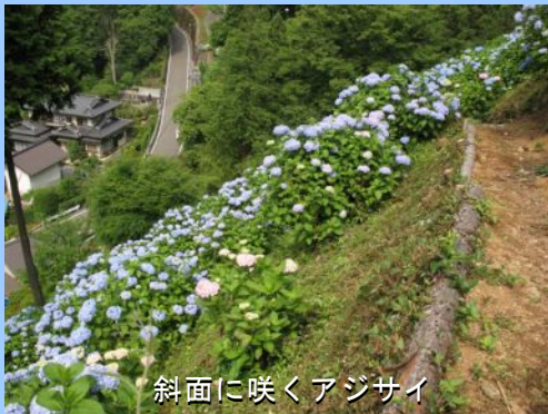
斜面に咲くアジサイ

センター周辺では、イワツバメが巣立った雛と共に勢いよく飛びまわり、裏の杉林からはサンコウチョウの鳴き声が聞こえてきます。