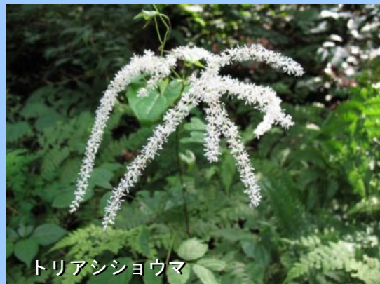
トリアシショウマ

陣馬山頂ではキンポウゲ・トリアシショウマ・オオバギボウシ・オカトラノオなどが咲き、ウラギンスジヒヨウモン・サカハチチョウなどの蝶たちが舞っています。