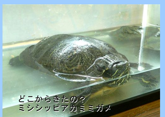
どこからきたの？ミシシippアカミミガメ

これはミシシippアカミミガメ(ミドリガメ)といって、主にペット用として外国からもちこまれた生きものです。丹沢湖には、この他にも本来ならばこの地域にはいないはずの生きもの達が数多く確認されています。どうしてここにいるの？このままでいいのかな？この機会に真剣に考えてみませんか？(斎藤)