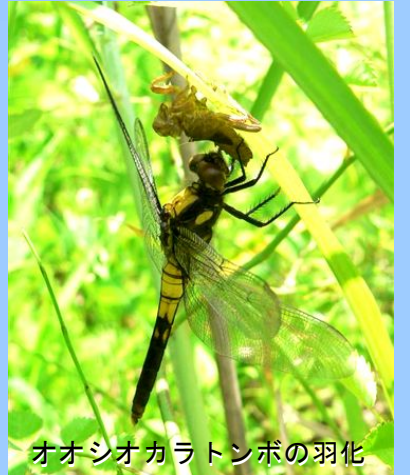
オオシオカラトンボの羽化

いま昆虫達は大変身の季節です！毎朝のようにトンボ達がヤゴから成虫への大変身をとげています。最初は透明な体が、次第に色づいていく様子はとても不思議です。またエノキの葉の上では、ゴマダラチョウが卵からかえり、脱皮しながらぐんぐんと大きくなっていく様子を観察することができます。教科書やテレビで見た昆虫達のふ化や羽化のシーンを、本当に自分の目で見てみる。この夏、そんな体験をしにきませんか？