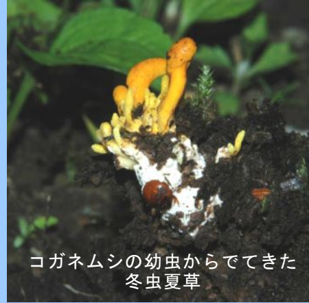
コガネムシの幼虫からでてきた冬虫夏草

自然の中には、まだまだ不思議に思うことがたくさんあります。今回はその一つ、足元にあった小さな、そしてとても奇妙なものをご紹介します。