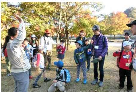
自然の中にはひみつの繋がりがいっぱい。みんな楽しく探検してね。