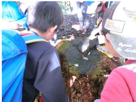
木が土にかえていくよ。フワフワの朽木やそこに生える実生を観察。