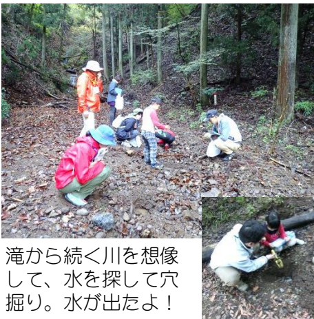
滝から続く川を想像して、水を探して穴掘り。水が出たよ！