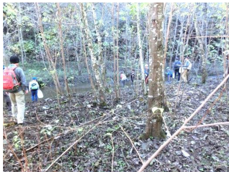
午後からは、森から流れる沢で探検です。まずは沢の森を観察。