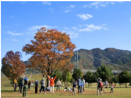
探検前の準備運動です。足元にはシカの糞や足跡もありました。

気持ちの良い青空が広がった中、宮ヶ瀬湖畔園地周辺の森と沢の探検に出かけます。自然の中には面白いものがいっぱい。森や水のひみつのつながりにも気付くことができるかな。