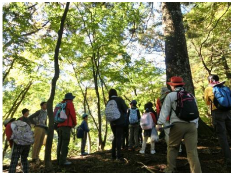
午前中は、モミの巨木林へ。大きな木の広がる森で探検です。