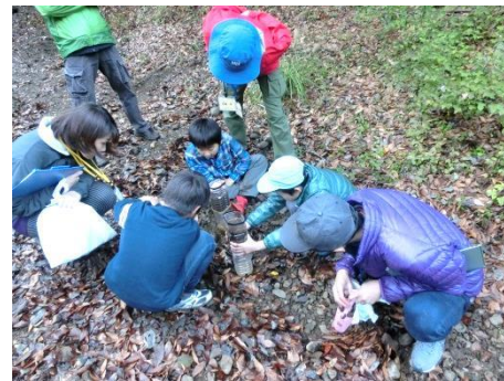
森の土と固めた森の土、沢の土で水の浸み込み方の実験！