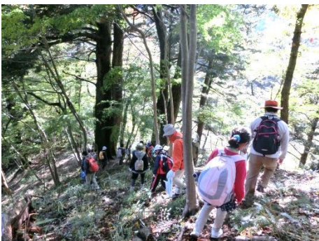
森から獣道をたどってみよう。足元には気を付けて！！

モミの大きさどのくらい？指を広げて尺取虫で21回、抱き着いて3回など、いろいろな方法で大きさを測ります。