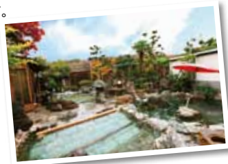
全国美肌の湯ベスト9に選ばれた七沢荘の美肌の湯

七沢温泉、広沢寺温泉、かぶと湯温泉の8軒の旅館からなる東丹沢山麓の温泉郷です。厚木市の奥座敷として、丹沢帰りの行楽客などに多く利用されています。泉質は無色透明の強アルカリ泉で、皮膚を乳化する美人の湯・体が良く温まる子宝の湯としても有名です。