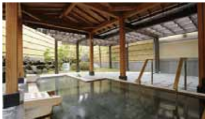
里山をイメージした「檜造り」の里湯

小田急鶴巻温泉駅の周辺にあるこの温泉は、井戸水が塩分を含み、渋味が強いことから、飲料水に適さず、また灌漑用水にも使えないので、浴用にしたのが始まりと言われていています。明治から大正にかけて開かれ、大正時代は大山詣の客が多く立ち寄ったそうです。カルシウムが非常に豊富で、神経痛、婦人病、外傷などに効果があると言われていています。