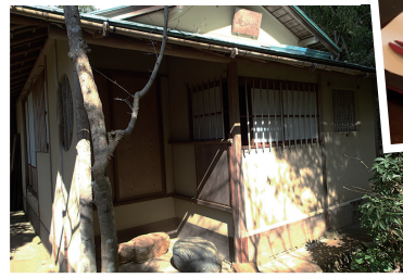
城山庵入口。茶の湯は武士とともに育まれた文化。中では密談が交わされたこともあったとか。忍者の侵入を防ぐため、天井裏は存在せず、縁の下は板でふさがれています。