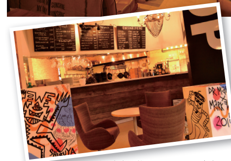
▲店内に飾られているオブジェは英国のアーティスト マーク・ウィガンによるオリジナル。