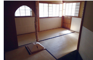
城山庵の内部。刀を外し、奥に見える襦袢口(にじりぐち)から身を屈めて中に入ること、身分や地位に関係なく、中ではお互い平等になるという意味があります。