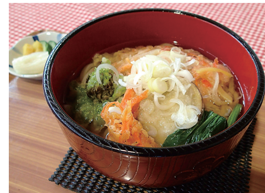
かきあげうどん 400円。この日の天ぷらは採れたてのフキノトウ。旬の食材が季節を感じさせてくれる。

営業日 土・日・祝日 水曜日(7、8、1、2月は除く) 営業時間 11:00~15:00(なくなり次第終了) 住所 茅ヶ崎市芹沢1030 問合せ TEL 0467-50-6058 (茅ヶ崎里山公園パークセンター) アクセス 茅ヶ崎駅または湘南台駅からバス「芹沢入口」下車5分。駐車場あり(有料)