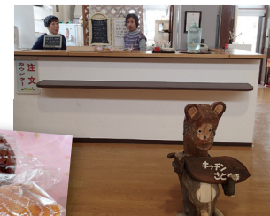
▲店頭では木彫りのタヌキ君がお出迎え。里山らしい風情を醸し出す。