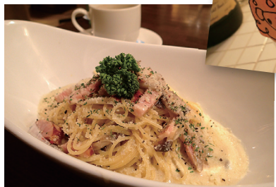
きのこベーコンのピーナッツバタークリームパスタ 900円。ほのかにピーナッツが香る濃厚なクリームと、アルデンテのパスタがよく絡んで味わい深い。

ブルックリンスタイルをベースにした内装は元デザイナーでもある店長のプロデュース。いわゆる「公園の休憩所」とは一線を画す、いい意味でびっくりしてもらえるような雰囲気を作り出している。といっても奇抜なスタイルではなく、公園の自然と調和したゆっくり過ごせる空間となっている。