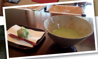
▲抹茶(生菓子付き)500円。茶釜のお湯で点てた抹茶と、地元の和菓子店から毎日仕入れる四季折々の生菓子。