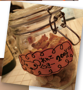
▲さつまいもと小麦を練り込んだオリジナルわんこくッキーは200円。テラス席はわんこ連れで利用可能。