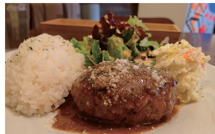
手ごねハンバーグランチ 1,100円。ソースからドレッシングまで、すべてオリジナルにこだわって作られている。

毎週変わる4つのランチメニューは、季節や気候に合わせて旬の食材を使用。いつ来ても飽きない工夫がされている。グランドメニューもお客様の声に合わせて、頻繁に更新される。ティータイムの人気メニューは、ボリュームたっぷりの豆乳シナモンフレンチトースト。夕方からはホットワインがおすすめ。オレンジと蜂蜜、シナモンを加えた本格派で、海外の方からも好評を得ている。