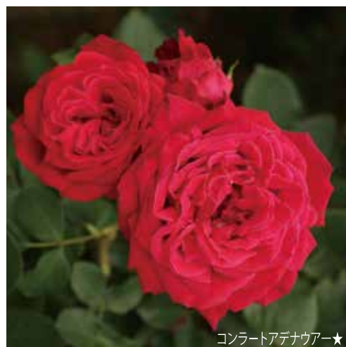
コンラートアデナウアー★