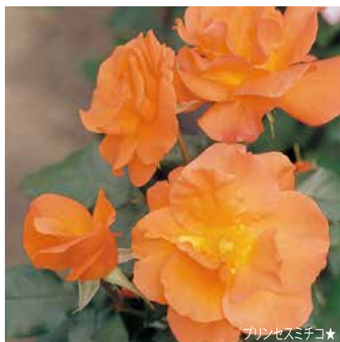
プリンセスミチコ★