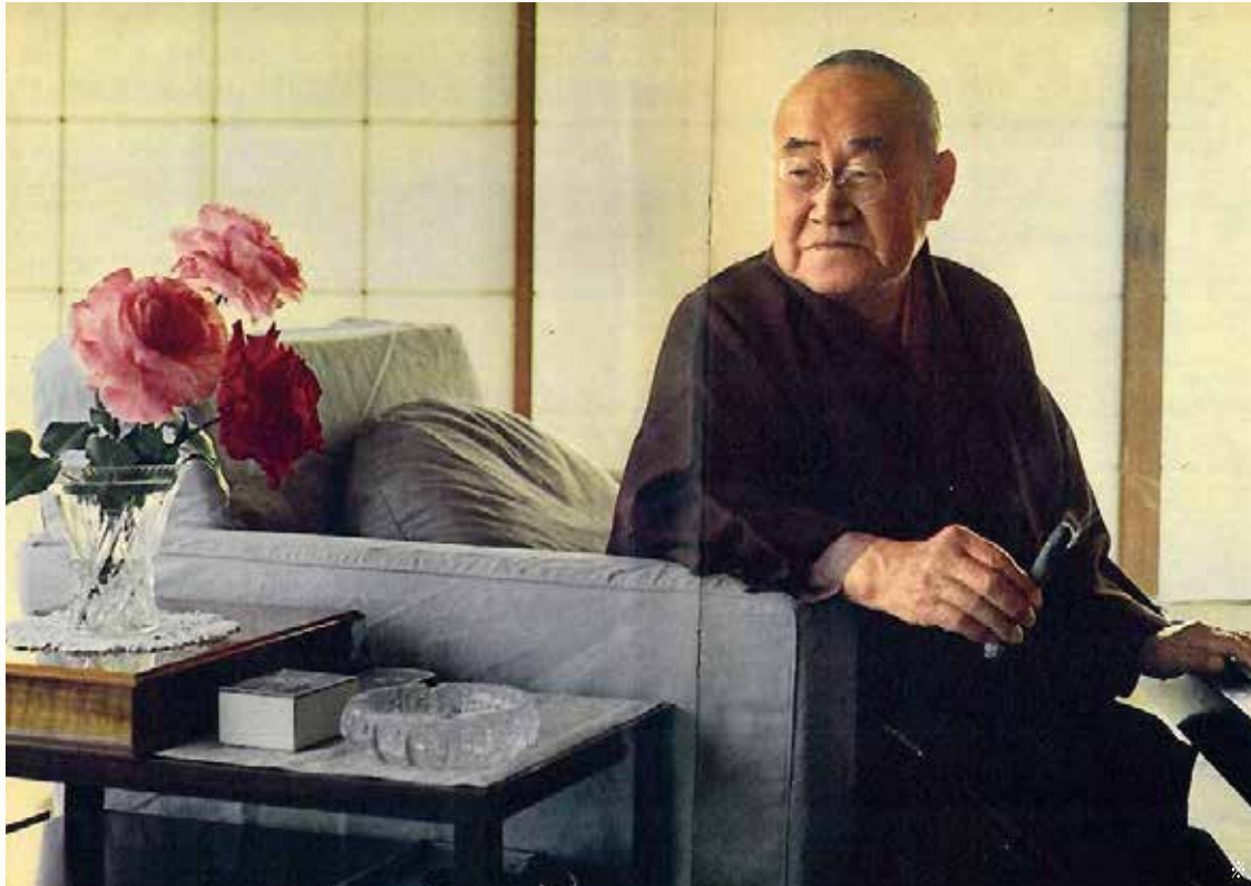
バラを愛した吉田茂