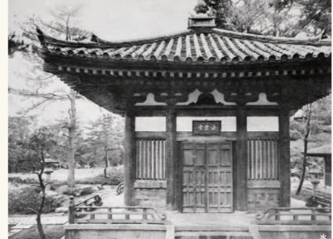
法雲堂：主に薬師寺の古材を用いて建てられています。台座はそのまま残され、現在は休憩所が設置されています