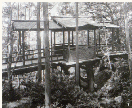
通雲橋：国府橋のあるところには、京都東福寺の通天橋の古材を使用した檜皮葺屋根と腰掛のある「通雲橋」が架かっていました

展望台から不動池にいたる西北山麓一帯では、三井時代から残る小道の散策が楽しめます。