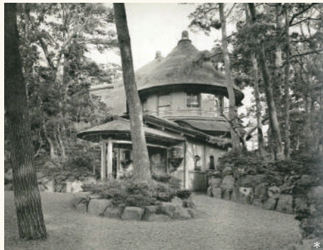
城山荘の玄関周辺の石組みは現在も一部残っています