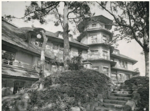
正面が「養老閣」現在の展望台は養老閣と同じ8角形で、屋根の上に鶴の置物を配置しています