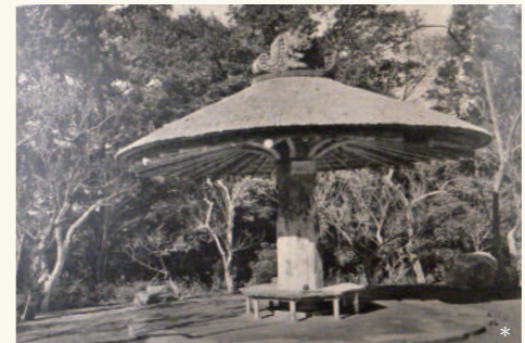
大圓亭：あずまや風の休憩所で鬼瓦は浅草寺の古材が使われていました

ひかりの広場周辺には、多くの御堂などが点在していました。今は移築されて残っていませんが、当時の地形や通路を利用し、落ち着いた雰囲気醸し出しています。