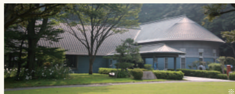
城山荘車寄せをモチーフとした外観です