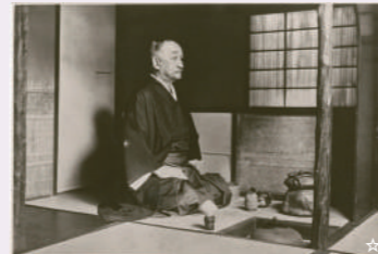
昭和3年 茶室「如庵」での三井高棟

時の移り変わりにより荒廃した時期もありましたが、多くの人々の声を受け、昭和58年(1983)、都市計画公園に指定され、その後整備を経て平成2年(1990)に全面開園となりました。