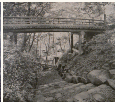
流雲橋：階段の上にかけていられた橋げたの礎石の一部が現在でも残っています