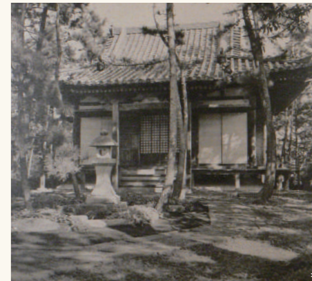
大雄殿：薬師寺にあった旧摩利支天堂が移築されていました