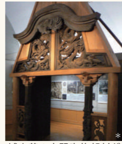
城山荘の広間吹抜部材が展示されています