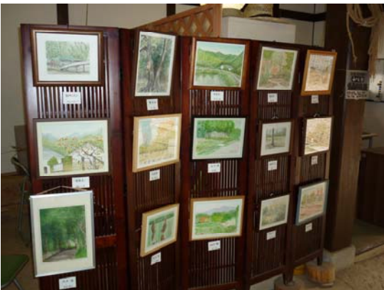
公園風景水彩画展