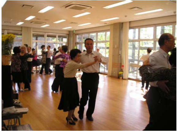
視覚障害者ダンスパーティ