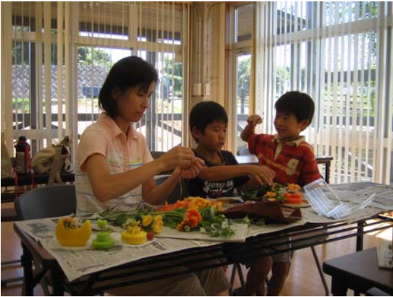
フラワーアレンジ教室