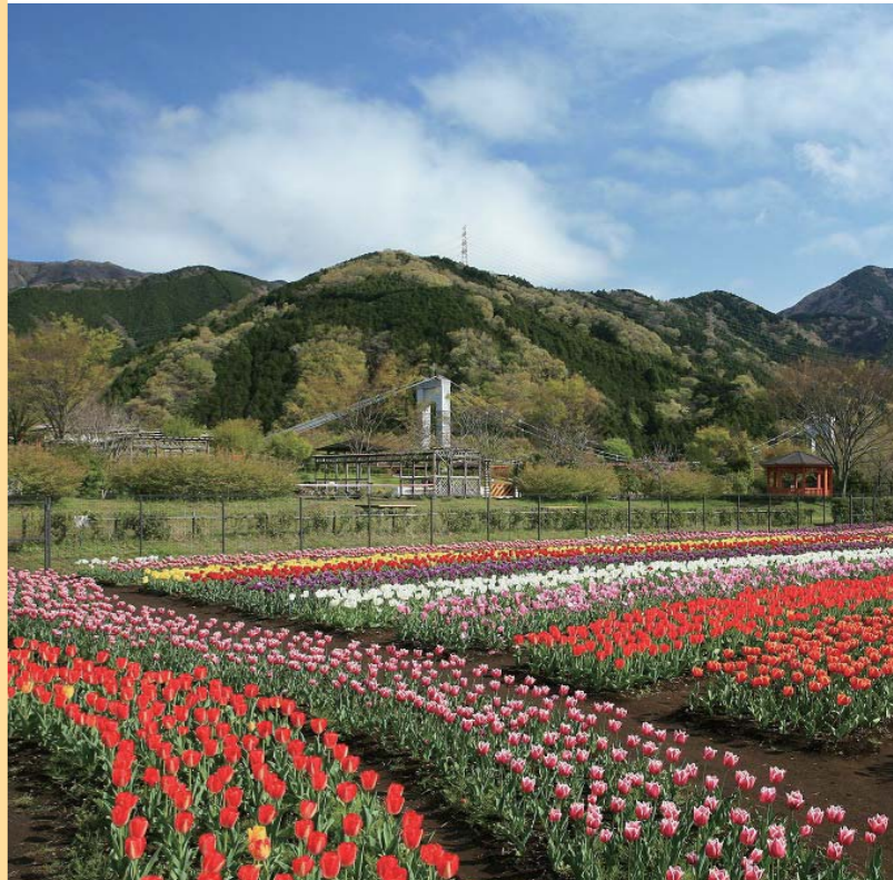
「山麓に広がる虹色絨毯(秦野戸川公園)」