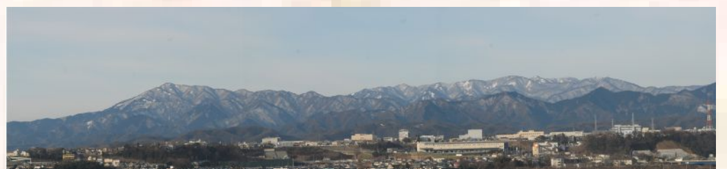
相模原市から見た丹沢大山国定公園