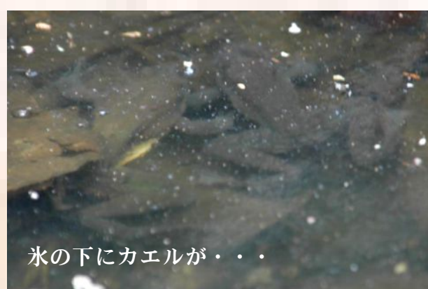
氷の下にカエルが・・・

そろそろ早春の便り「アカガエルの卵塊が…」という話が聞こえてくるころ。昨年、西山林道で発見したウジャウジャとオタマジャクシがひしめき合っていた小さな池(水溜り?)には、もうそろそろ卵があるかもと期待しながらのぞいてみました。小さな池は、厚い氷が表面を覆い、カエルが水溜りに入り込む隙間も見当たらない状態でした。取りあえずと近づいてよく見ると、その中であごめく影が…。カエルです。