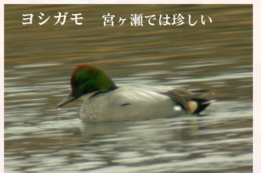
ヨシガモ 宮ヶ瀬では珍しい

たくさんの「目」が集まれば、いろんな自然物を発見出来る！これが観察会の楽しみでもあります。1月20日(日)に自然教室「宮ヶ瀬湖畔で冬の野鳥観察を楽しもう！」を開催しました。講師に(財)日本鳥類保護連盟の藤井氏をお迎えして、19名の参加者ととともに、じっくり冬の野鳥との出会いを楽しみました。