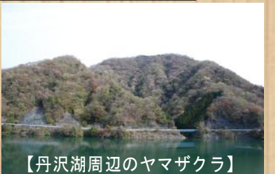
【丹沢湖周辺のヤマザクラ】

「ヤマザクラを満喫しませんか？」木々の緑が山を覆いつくす前に、優しい彩りで私たちの目を楽しませてくれるのがヤマザクラです。昨年のは、4月第1週～2週頃でした。湖畔をのんびりお散歩しながら、山の桜を満喫しませんか？(村上)