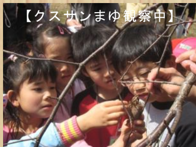
【クスサンまゆ観察中】

みんなで芽吹き始めた草木の様子を観察し、これから活発に動き始める生き物と出会い、いろいろな春を感じられた2日間でした。(篠島)