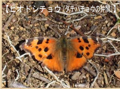
【ヒオドンシヨウ(タテハチョウの仲間)】