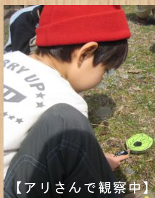
【アリさんで観察中】

「春の森へ飛び出そう！」春の足音も大きくなり始めた3月の中旬、子ども自然教室「春の森へ飛び出そう！」を開催しました。応募者は70名を越え、追加開催を行うほど大人気です。2日間を合わせて59名のご家族と一緒に「春探検隊」になってたくさんの春を探しました。