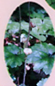
コチャルメルソウの実 チャルメウの形に見えるかな？