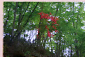
新緑の中のヤマツツジ