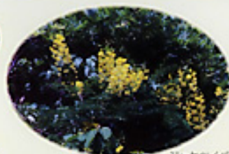
ジャックツイバラ

梅雨空のハイキングには実は良い点があります。曇り空やしとしと雨の中では、野鳥の声が大きく多く聞こえるように感じます。また意外と近くに姿を現してくれるのです。低い雲で音が散らないからか？ハイカーが少なく野鳥も安心して出てくるからか？雨の音に負けずと大きな声で鳴くの？理由はよく分かりません。