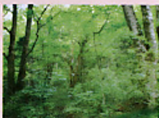
千歳の滝の上流に広がる森