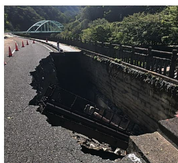
陥没した県道76号線 (台風19号通過直後)