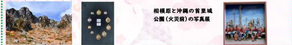
相模原と沖縄の首里城公園(火災前)の写真展

【サガミ MY フォトクラブ 定期展示会】写真展 2/25(水)~3/15(日) 【お部屋を飾る七宝焼】七宝焼額絵作品展 3/17(火)~4/5(日) 【公園の四季】写真展 4/7(火)~4/26(日) 【季節を感じて】立体絵画作品展 4/28(火)~5/17(日)