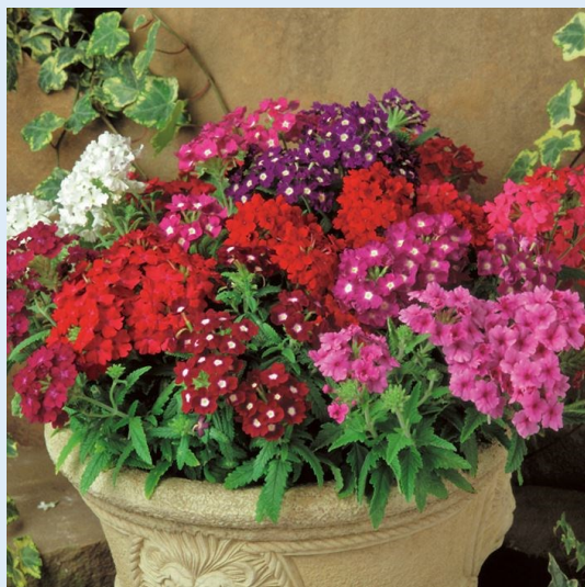
③ バーベナ 例)ミックス