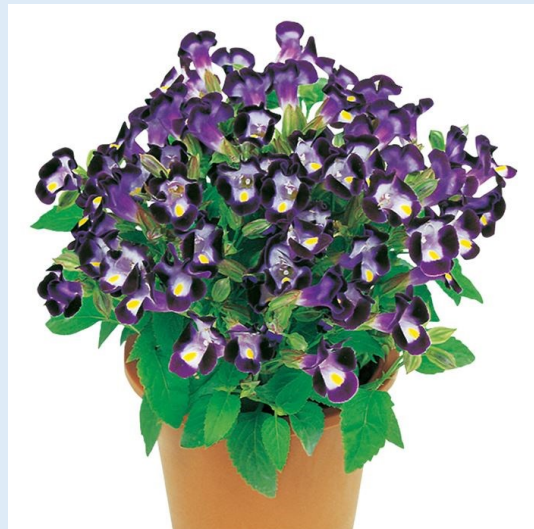
② トレニア 例)バイオレット