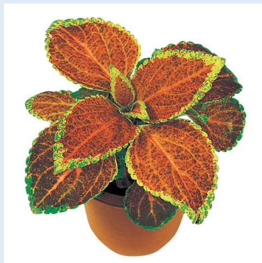
④ コリウス 例)オレンジ