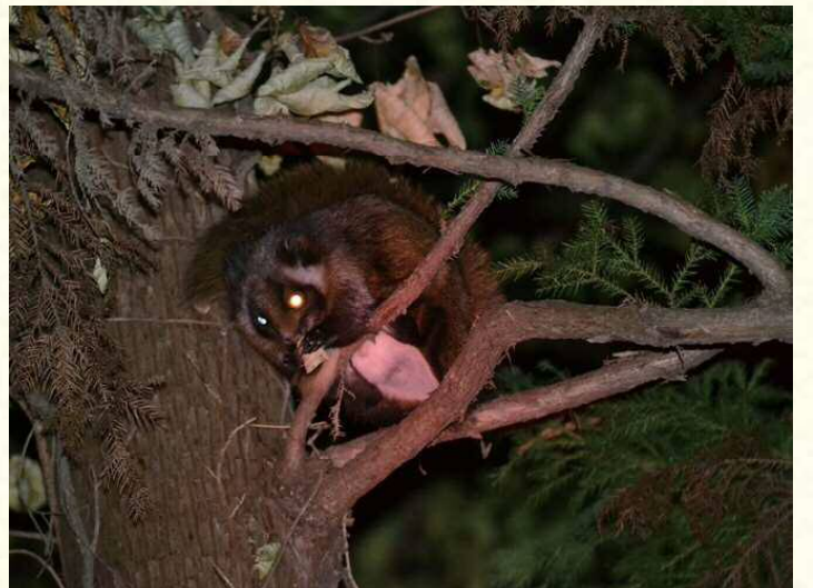
写真1：木の上で葉を食べる様子

怪しげな声が夜の森から聞こえてきます。昼間の森では聞いたこともない声です。鳥なのでしょうかね？虫なのでしょうかね？この声の正体は、・・・ムササビなのです(写真1)。 ムササビはネコくらいの大きさで、前足と後ろ足の間には皮膜(ひまく)があります。その皮膜をいっぱい広げて夜空を滑空(かっくう)します(写真2)。