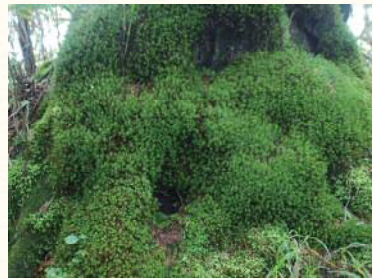
③コケ類に覆われた木の根元