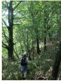
①みずみずしい森の高標高域で見られます。

写真②は大木に巻きついたツル植物 モコモコと、元 木を覆いつくし、よく見ると花も咲いています。「ツルアジサイ」で丹沢