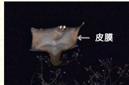
写真2：滑空する様子

ムササビは一生を木の上で過ごし、寝る場所も、食事もトイレも木の上です。 ムササビの繁殖期(はんしょくき)は春と秋の年2回あると言われますが、5～6月はその1回目にあたります(写真3)。繁殖期には1晩だけ森が騒がしくなることがあります。1頭のメスをめぐって数頭のオスが集まり、オス同士は激しく追いかけ合い、あちこちで枝が折れる音が聞こえ、木から落ちることさえあります。 夜に活動するムササビの姿を昼間に見ることはできませんが、地面をよく見るとムササビの痕跡を見つけることができます(写真4、写真5)。 皆さんも痕跡を見つけて木の上のムササビを想像してはいかがでしょうか。(木元)