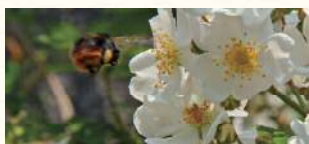
ノイバラの花粉レストラン マルハナバチがあしに花粉ダンゴをつけている