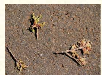
写真4：切り口が斜めにけがられた枝の食痕