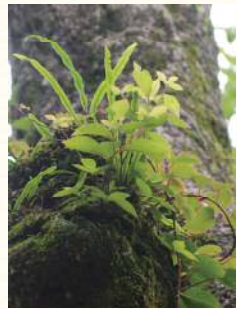
④木の幹に着生した植物