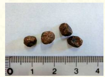
写真5：正露丸(せいろがん)のようなフン