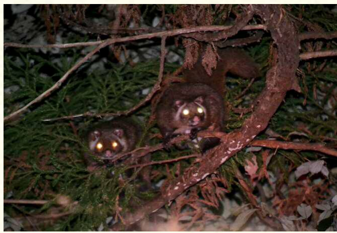
写真3：近くにいるメス(左)とオス(右)

ムササビは一生を木の上で過ごし、寝る場所も、食事もトイレも木の上です。 ムササビの繁殖期(はんしょくき)は春と秋の年2回あると言われますが、5～6月はその1回目にあたります(写真3)。繁殖期には1晩だけ森が騒がしくなることがあります。1頭のメスをめぐって数頭のオスが集まり、オス同士は激しく追いかけ合い、あちこちで枝が折れる音が聞こえ、木から落ちることさえあります。 夜に活動するムササビの姿を昼間に見ることはできませんが、地面をよく見るとムササビの痕跡を見つけることができます(写真4、写真5)。 皆さんも痕跡を見つけて木の上のムササビを想像してはいかがでしょうか。(木元)