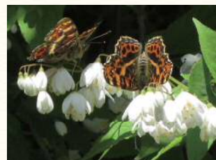
ヒメウツギを吸蜜する サカハチチョウ

「ウツギ」の名を持つ樹・・・最初にやや下向きに白い花を多数つける「ヒメウツギ」が、次に枝先に咲く花