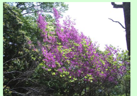
トウゴクミツバツツジ

今年の西丹沢の山開きは5月27日(日)8時から西丹沢自然教室を会場に行われます。山頂付近では、ゴヨウツツジの花もまだ咲いていることでしょう。安全登山の祈願をしますので、関心のある方はぜひお出でください。(倉持)