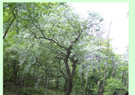
ゴヨウツツジ(別名:シロヤシオ)