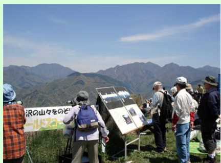
大野山から見た丹沢の山々

また、毎年4月29日には山頂で山開きが行われます。今年は晴天に恵まれ、たくさんの方で賑わいました。丹沢湖ビジターセンターも出展し、ビジターセンターの紹介や望遠鏡体験会を実施しました。やはり展望を楽しむ望遠鏡は人気で、子どもから大人まで楽しむ姿がみられました。(齋藤)