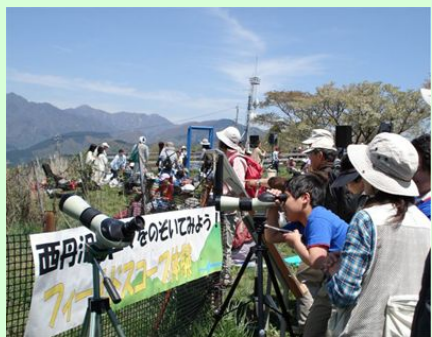
大人気の望遠鏡体験会